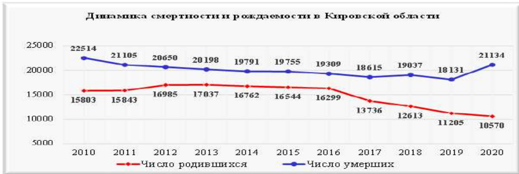
[그림 5. 키로프 주의 사망률과 출생율 2020년 기준]