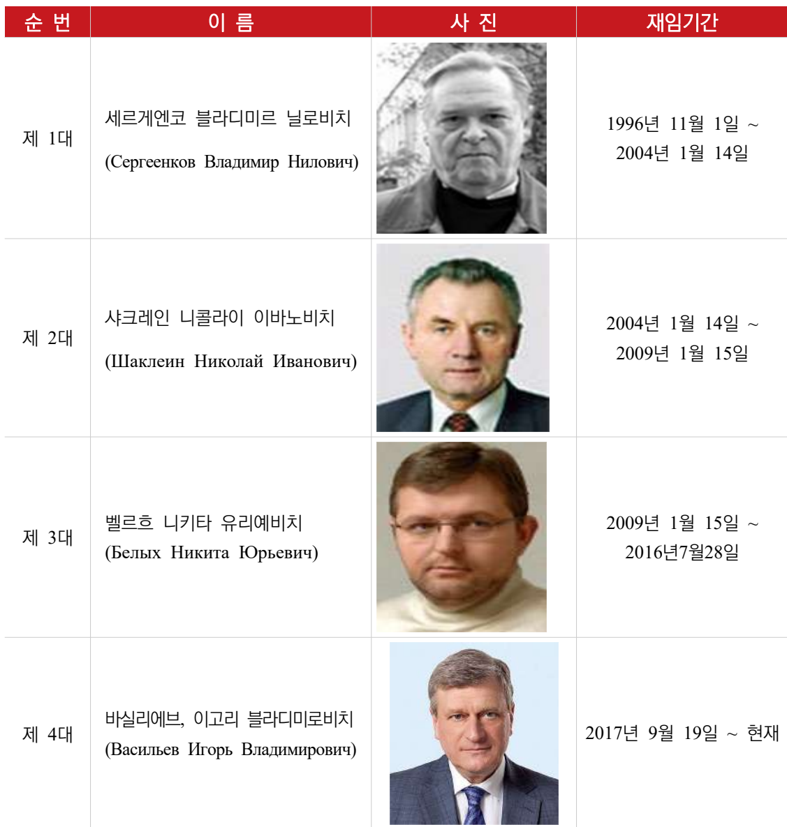
[표 4. 키로프주 역대 주지사]

키로프주의 최고 집행 기관은 주행정부이다. 주 행정부의 수반은 2017년 9월 19일의 푸틴 대통령 법령으로 임명된 바실리에브 이고리 블라디미로비치다. 키로프주의 영토에는 러시아 연방의 군력기관과 그 수장이 파견되어 있다. 지방 자치에 기초하여 키로프주 차원의 각종 행정부서 및 위원회가 활동하고 있다. 주지사는 이들과 함께 지방행정의 효율성을 위해 노력하고 있다. 주 차원의 집행과정은 키로프주 두마에서 제정한 <키로프주 헌장>이 기초가 된다. 키로프주 중심인 키로프시에는 집행권력의 최고 기관으로 시행정부가 있다. 2017년 9월부터 코발료바 옐레나 바실리에브나(Ковалёва Елена Васильевна)가 시장이다.