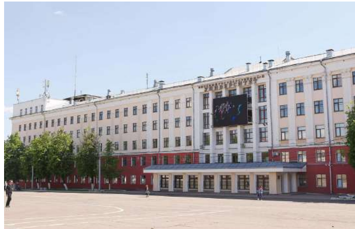
[그림7. 바트카 국립 대학]