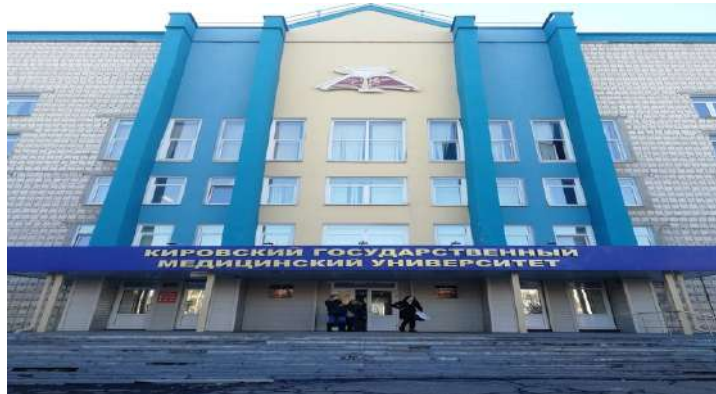
[그림8. 키로프 국립 의학 대학]