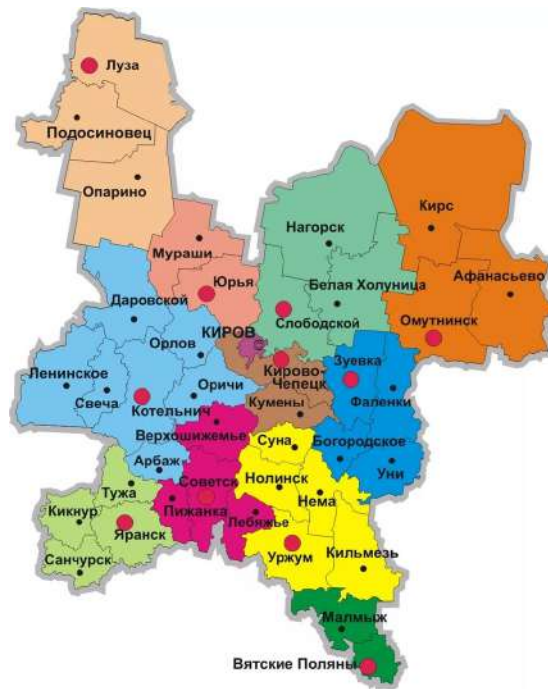
[그림 4. 키로프주 행정구역]