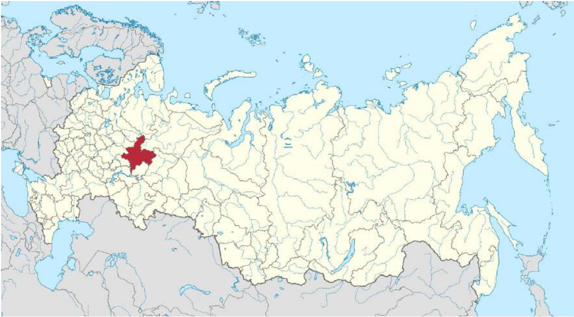
[그림 1. 키로프주]