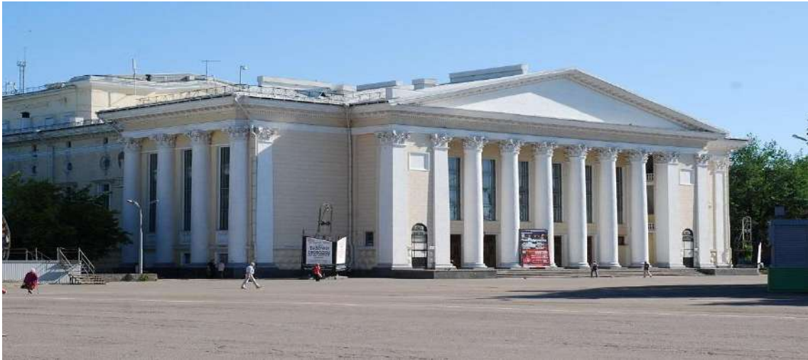
[그림 6. 키로브 주의 드라마 극장]