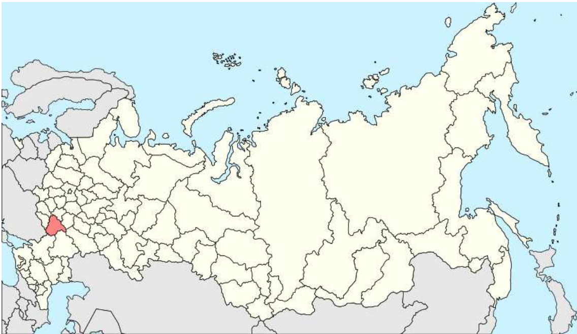
[그림 1. 보로네시주]