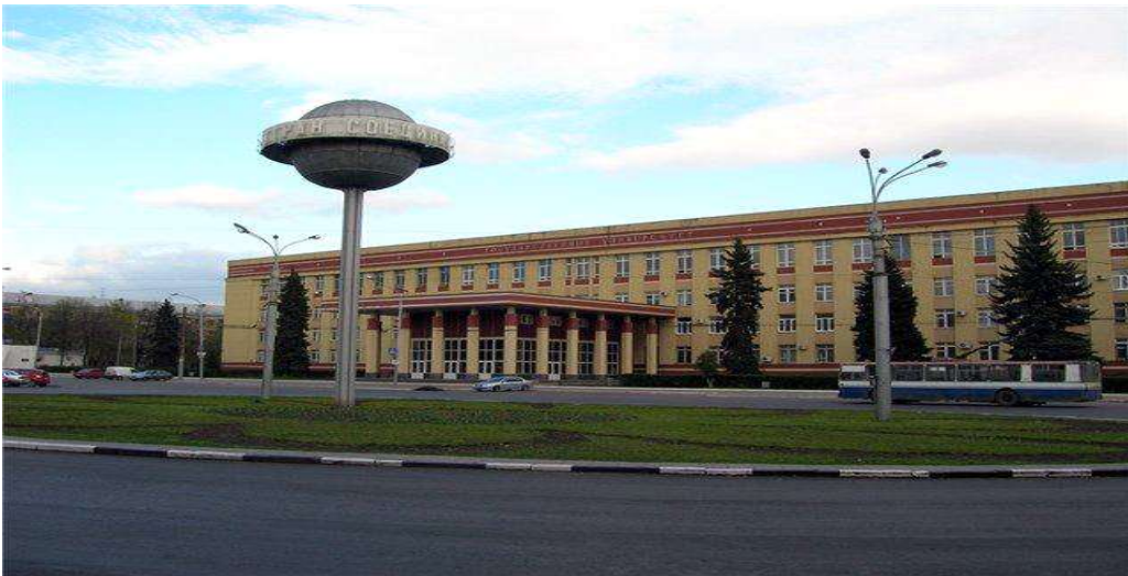
[그림 10. 보로네시 국립대학교]

자료: https://otzovik.com/reviews/voronezhskiy_gosudarstvenniy_universitet_russia_voronezh/ ( 검색일: 2020.07.07)