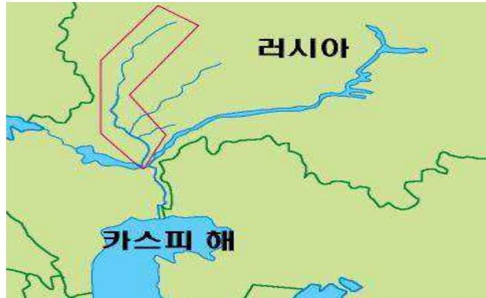
[그림 2. 돈강]