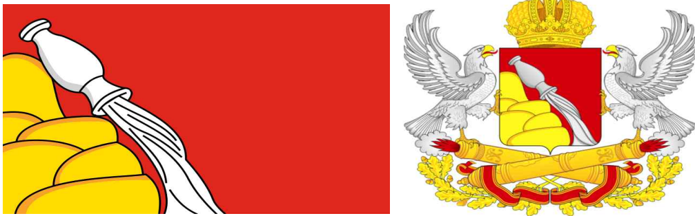
[그림 5. 보로네시주 주기(좌)와 문장(우)]