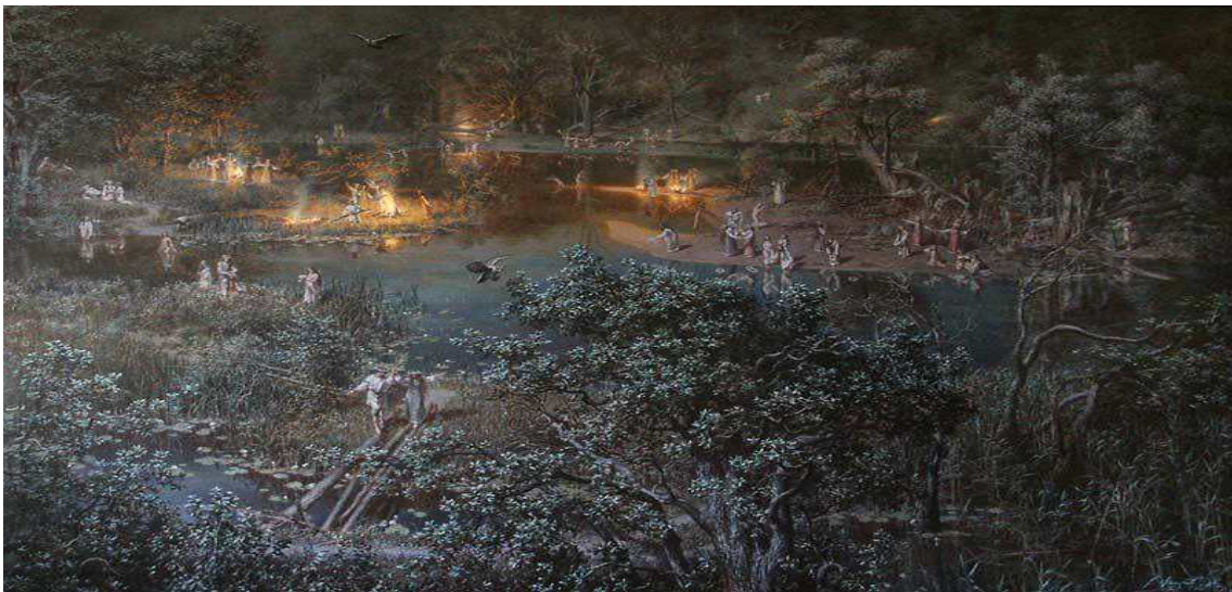
[그림 8. 드미트리 피수노프(Дмитрий Фисунов)의 작품]