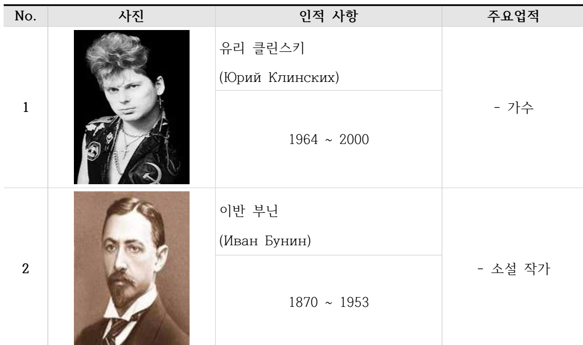
[표 18. 스몰렌스크주 유명인사]