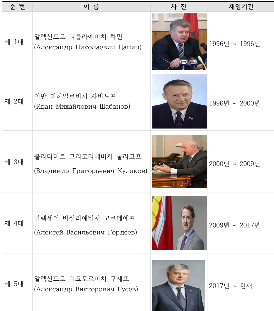
[표 3. 보로네시주 역대 주지사]