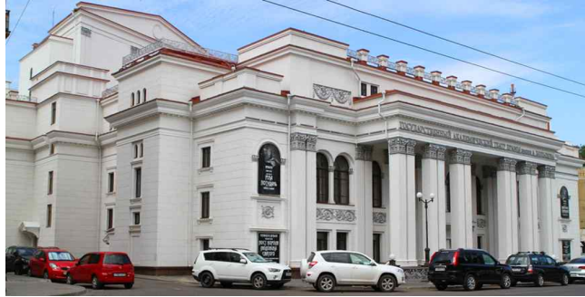
[그림 9. 콜쇼프 국립아카데미 극장]