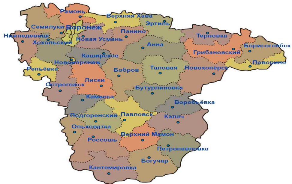
[그림 6. 보로네시주 행정구역]