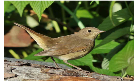
[그림 8. 쿠르스크 피꼬리]