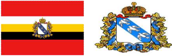
[그림 3. 쿠르스크주 주기(좌)와 문장(우)]