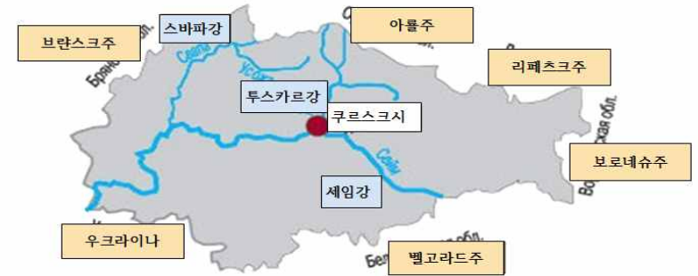
[그림 2. 쿠르스크주 주요 강]