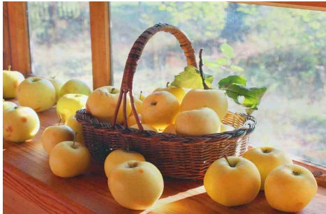
[그림 7. 쿠르스크 안토노프카 사과]