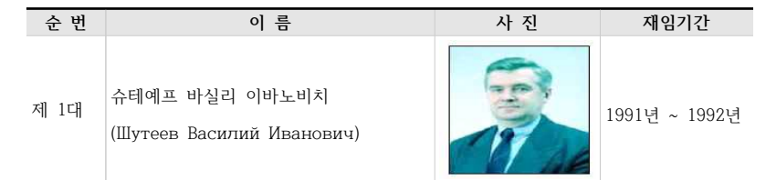
[표 7. 쿠르스크주 역대 주지사]

현재 쿠르스크주 주지사는 로만 블라디미로비치 스타로보이트로 2018년 전임 주지사였던 알렉산드르 니콜라예비치 미하일로프가 2018년 비리로 주지사직에서 해임되자 2018년 10월 11일부로 로만 블라디미로비치 스타로보이트가 임시 주지사로 임명되었고 1년뒤 2019년 9월 8일 81.7%의 득표를 얻으며 주지사로 당선되었고 2019년 9월 16일 취임했다. 16)