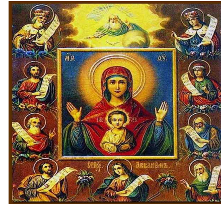
[그림 6. 성모발현 이콘]