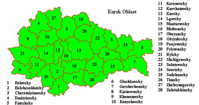
[그림 4. 쿠르스크주 행정구역]