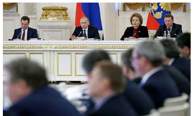
러시아는 2014년에 「국가 문화정책의 기초」를 제정했다.

러시아 문화정책에서 국가-문명론은 전통적 가치 보존을 핵심 원리로 한다. 2014년에 제정했고 2023년 개정된 「국가 문화정책의 기초」에는 러시아 국가-문명론 관련 내용이 대폭 삽입됐다. 이 개정된 문화정책에서 러시아는 자신의 고유한 문화를 기초로 형성되어 왔다고 다음과 같이 강조한다. "러시아는 위대한 문화, 방대한 문화유산, 수 세기 동안 이어져 온 문화적 전통, 그리고 무한한 창조적 잠재력을 지닌 나라"이며, "러시아의 역사적 여정은 다국적·다종교적 러시아 사회에서 러시아의 문화적 정체성, 민족적 사고방식의 특징, 그리고 삶의 가치 기반을 규정해 왔다." 나아가 "러시아의 문화는 천연 자원만큼이나 러시아의 유산이다. 현대 사회에서 문화는 사회 경제 발전의 중요한 자원이 되고 있다"라고 강조하면서 오늘날의 러시아 문화를, 자국 발전을 위한 중요한 물질 자산으로까지 비유한다.