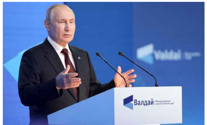
블라디미르 푸틴 러시아 대통령

우선 2012년 푸틴 대통령은 대통령 선거 과정에서 발표한 일련의 정책 담화에서 “러시아는 수 세기에 걸쳐 다민족 국가로 부상하고 발전했다. 가족, 우정, 직업적 차원에서 끊임없이 상호 적응하고, 서로 침투하며, 민족들이 섞이는 과정이 진행된 국가였다. [...] 러시아 국민의 자기 정체성은 러시아의 문화적 핵심으로 결속된 다민족 문명이다.”라고 천명했다.