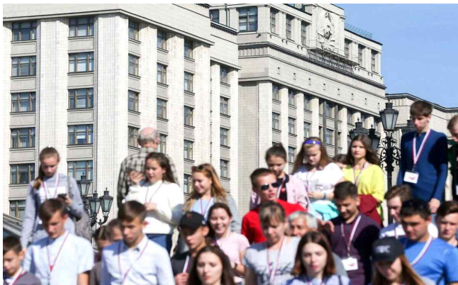
2022년 러시아 국가두마가 채택한 「러시아 아동·청소년 운동법」을 연방의회에서 승인했다.

2022년에는 국가두마(하원)가 「러시아 아동·청소년 운동법」을 채택하고, 연방의회(상원)가 승인했다. 이 법안은 2023년과 2024년에도 개정됐다. 이 연방 법률은 교육 기관, 협회, 운동, 공동체와 클럽에서 아동·청소년 교육을 위한 통일된 정책을 개발하고, 아동·청소년 지원을 통합·강화하며, 사회 참여를 증진하기 위해 러시아 아동·청소년 운동 설립을 규정한다. 이 운동의 목표는 “러시아의 전통적인 정신적, 도덕적 가치, 러시아연방 민족의 전통, 그리고 러시아 및 세계 문화의 업적에 기반한 세계관 형성을 포함”한다. 또한, “조국에 대한 사랑과 존경, 근면, 법적 의식, 환경 보호, 현재와 미래 세대에 대한 자신의 운명과 조국의 운명에 대한 개인적 책임감” 등을 개발하는 것이 포함된다. 이 법은 러시아 국가-문명 담론을 조기 교육을 통해 내면화하는 것을 제도적으로 구축한 것이며, 이를 위해 청소년 단체를 국가가 직접 지원하는 틀을 마련했다.